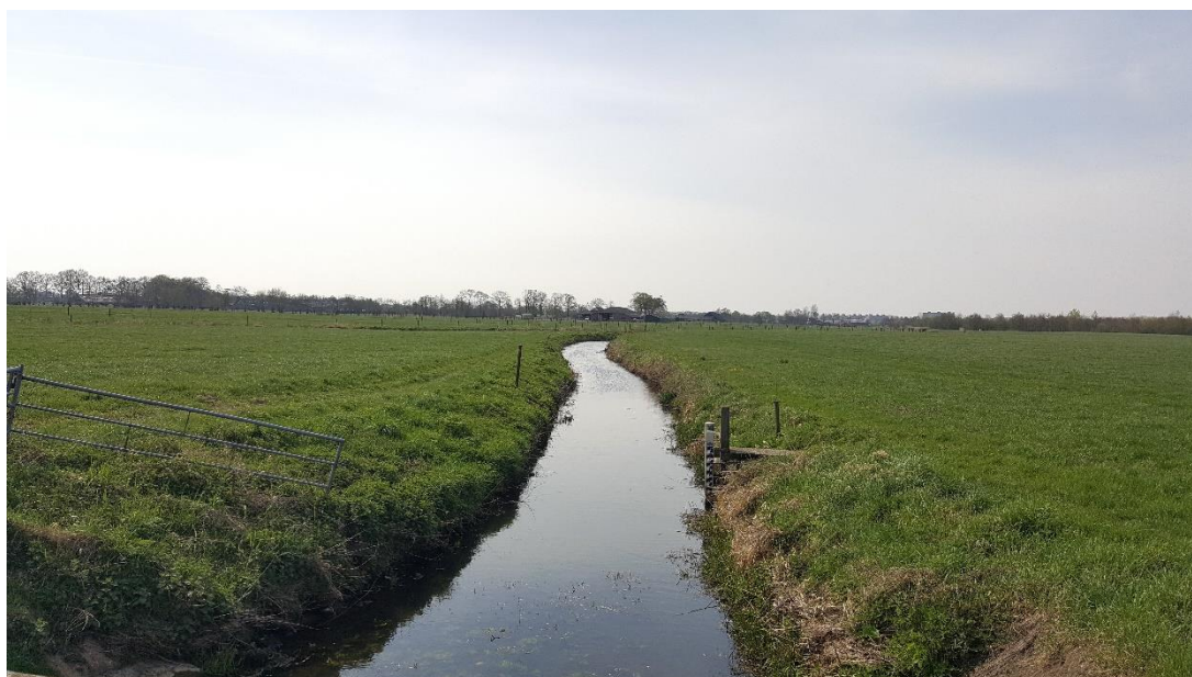
Figuur 2: Foto locatie tijdens veldbezoek op 9 april 2019.