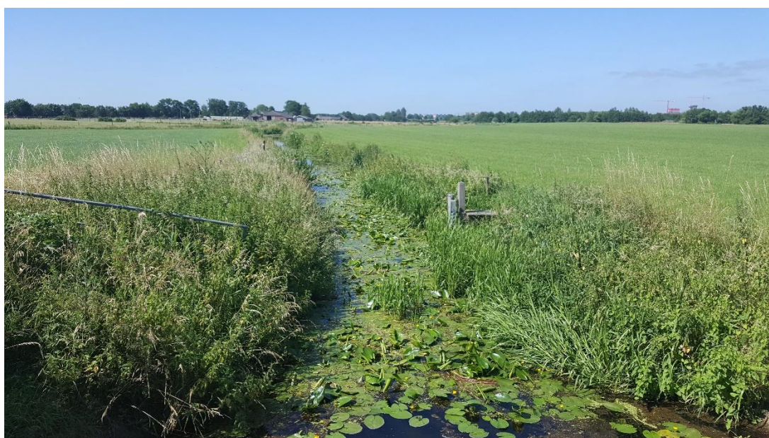
Figuur 3: Foto locatie tijdens veldbezoek op 27 juni 2019.